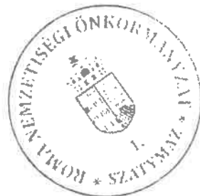
Kolompár Ibolya jegyzőkönyvhitelesítő