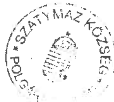
Barna Károly polgármester