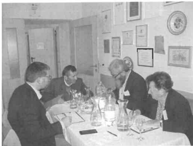
Borminősítés - Szatymaz, 2010.

1. Az értéktárba felvételre javasolt nemzeti érték fényképe vagy audiovizuális-dokumentációja