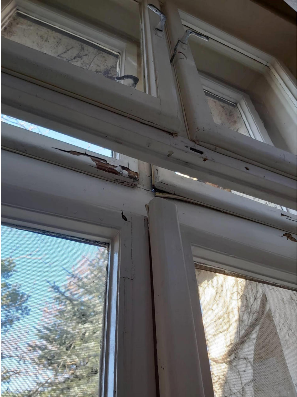
Ebédülő ablak csukott állapotban.