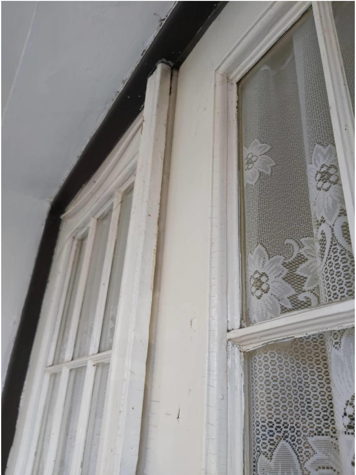
Csukott, bejárati ajtó.