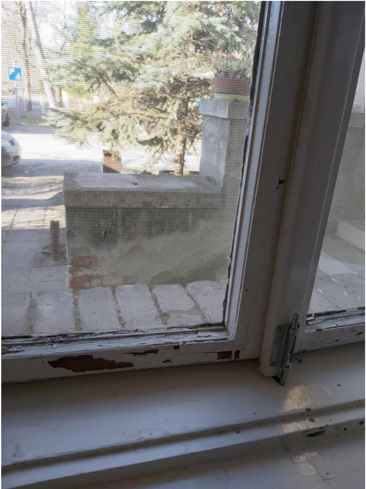
Az épület hátsó részén található ebédlő ablaka.