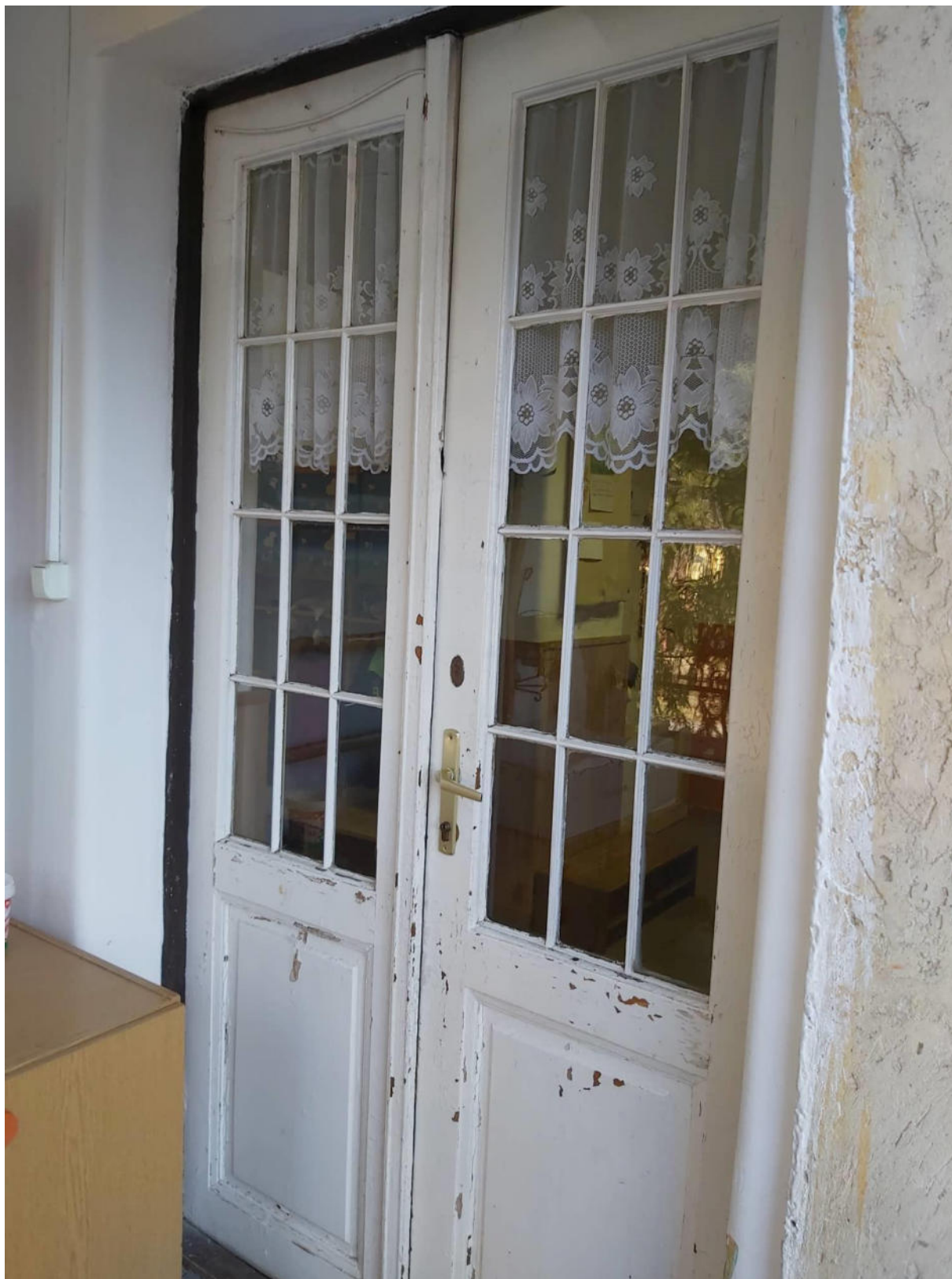
Hátsó csoportszoba bejárati ajtó.