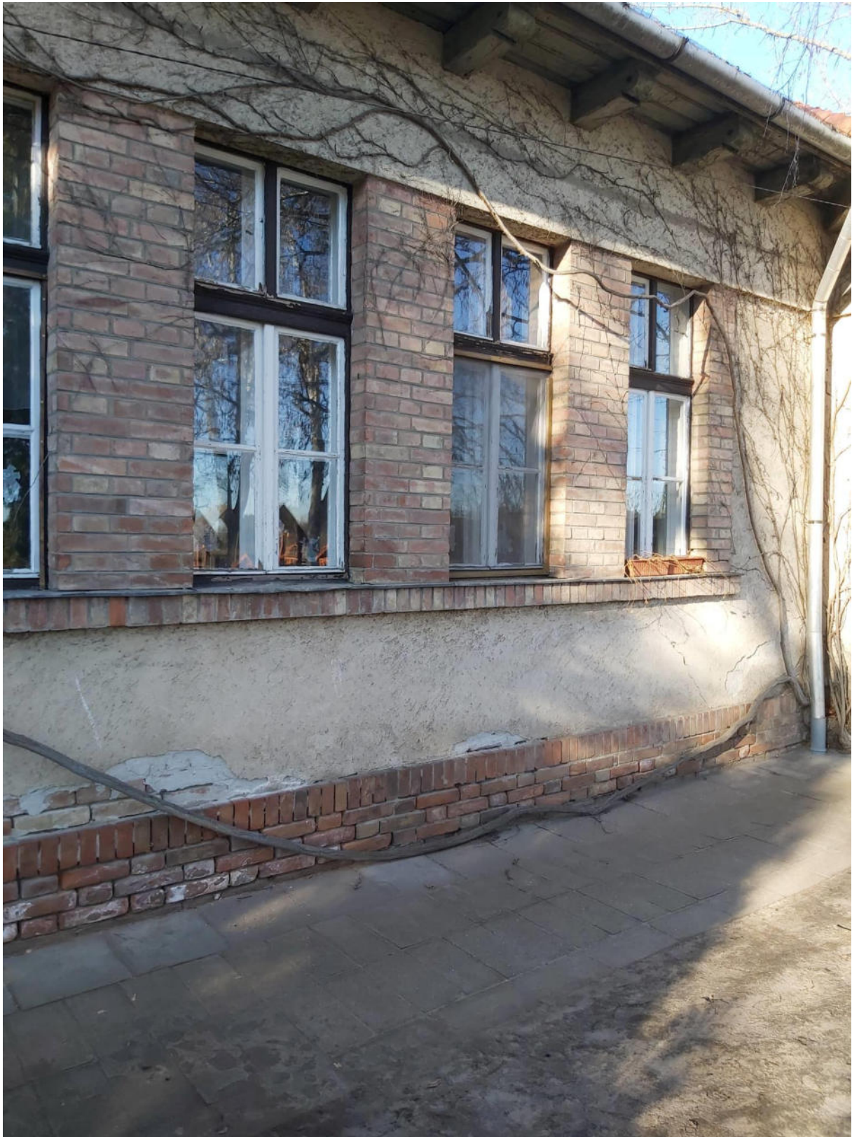
Eredeti iskolaépület ablakai. Ma már a felső ablakok csavarral vannak rögzítve.