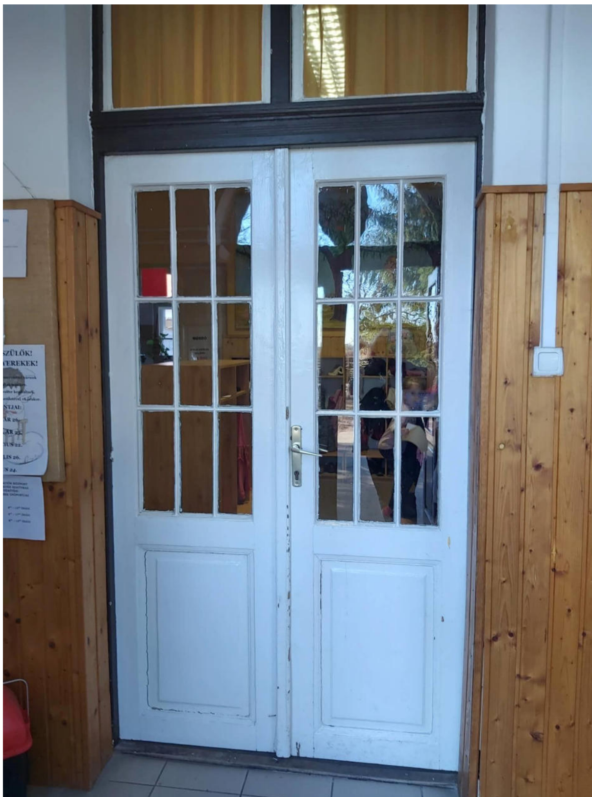
Főbejárat, belső ajtó